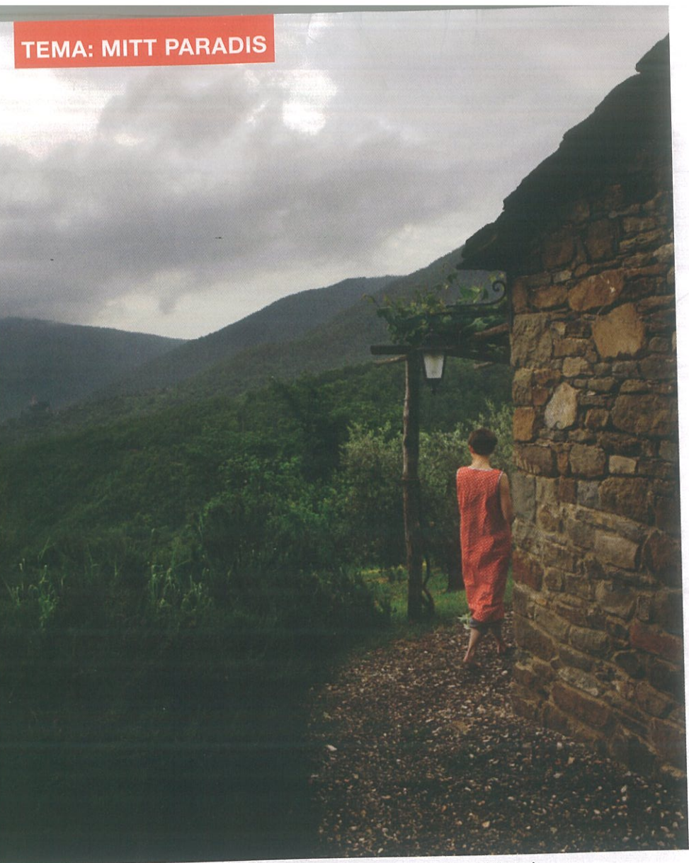
Fra alle kanter av Nicconedalen synger fuglene. Det er naturens orkester i stereo!

genuine. Moderne turister leter etter steder med orginale kvaliteter, hvor maten, historien og naturen til sammen danner en fullverdig opplevelse. Denne delen av Toscana, området ved vindistriktet Montepulciano, er det ekte Toscana, ivrer Di Rosa. – Dette er ekte. Med de store globale utfordringer verden står overfor, blir det stadig viktigere at hvert sted tar vare på sin egenart. Faren ved globalisering er at alt blir likt. Det er en katastrofe! Alt blir flatt. Se bare på moteverdenen: Dolce&Gabbana, Louis Vuitton og Chanel er merker du får kjøpt overalt. – Men dette – det er originalt. Du kan ta på det, og gni deg opp mot det. Selv i dette været. Til og med regnet lukter annerledes i Borgo Di Vagli! Alle som kommer til Italia ser solsikkene. Hva med å se forbi dem? Se bakenfor horisonten?