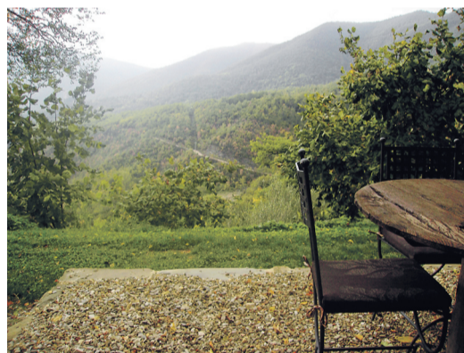
Landsbyen ligger i lidt over 500 meters højde. I vintermånederne kan man godt risikere at sne inde, men man kan også være heldigt, at vejret er til en frokost udendørs i januar.

Han har inviteret to svenske og overtegnede danske journalister til bjerglandsbyen Borgo di Vagli midt i Toscana for at vise sit seneste restaureringsprojekt frem og få det formidlet videre til skandinaver, som sætter pris på både italiensk natur og kultur og måske derfor drømmer om at købe en lille bid fast ejendom i den populære re-