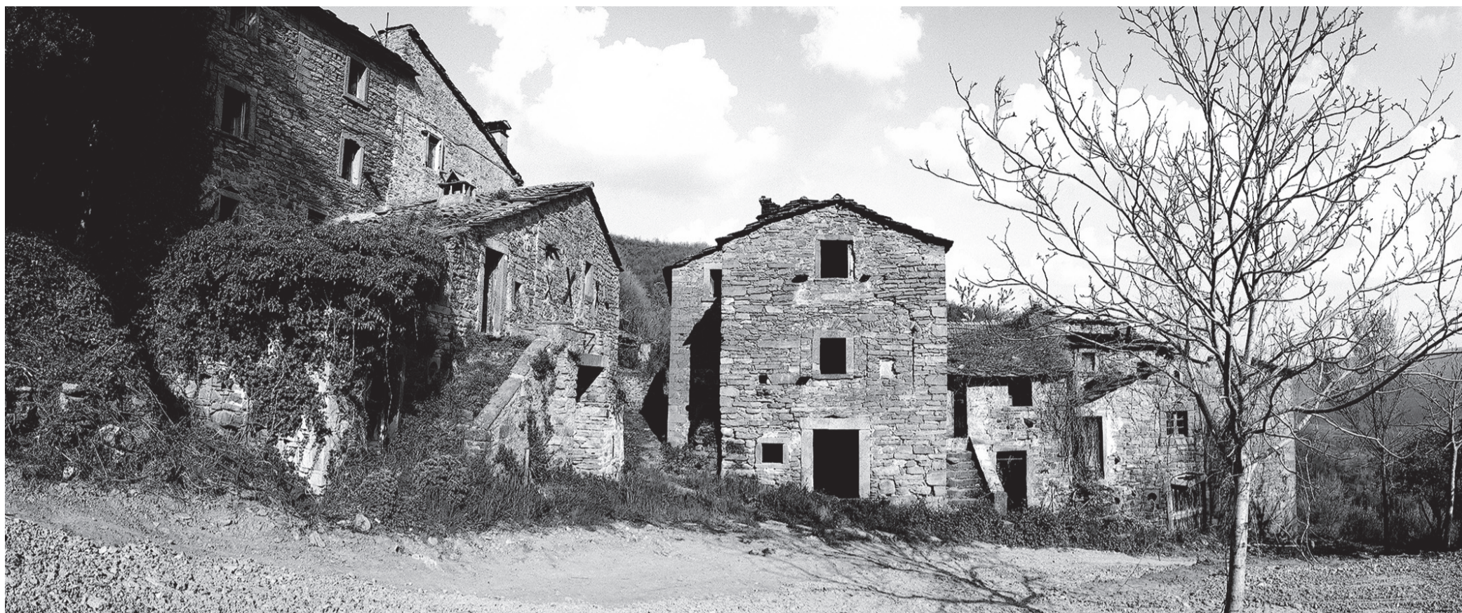
Sådan så den forladte landsby ud, da arkitekten Fulvio di Rosa første gang kom kørende hertil for 17 år siden.