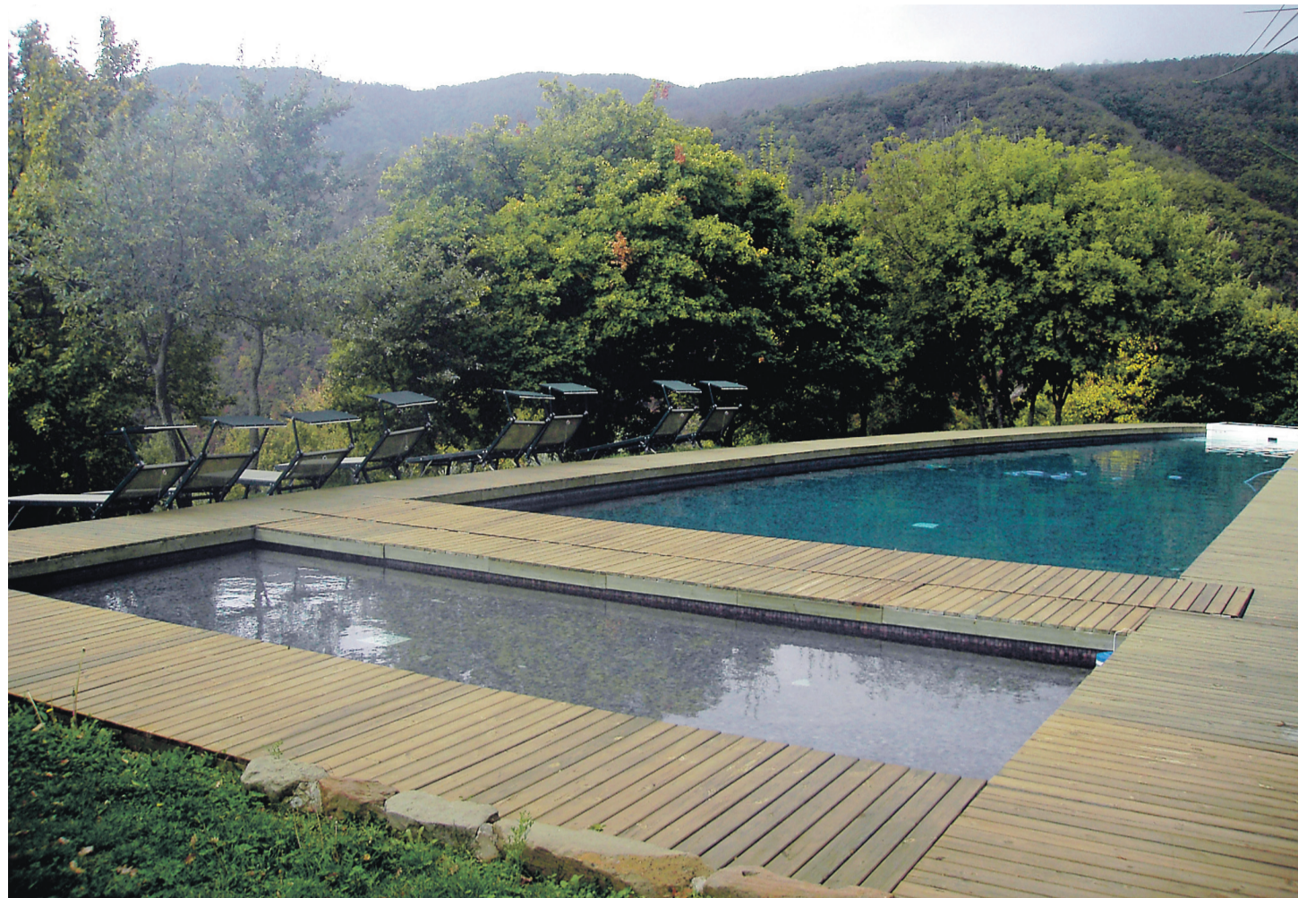
På skråningen oven for landsbyens huse kan beboerne nyde den opvarmede swimmingpool.