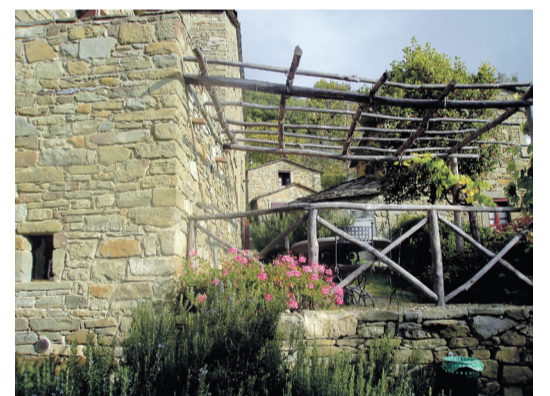
Uden for alle lejlighederne er der en lille terrasse med pergola. Her kan man sidde i fred og ro for nabokig og nyde udsigten over dalen.

gion. Økonomisk er mulighederne lidt mere fremkommelige end normalt, for boligerne i Borgo di Vagli-komplekset sælges på sameje-vilkår (læs mere i artikelen side 8.red.).